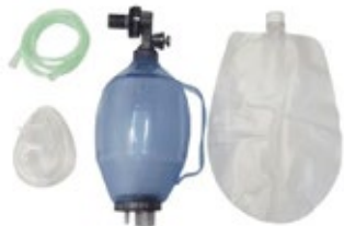
Ambu Completo Adulto