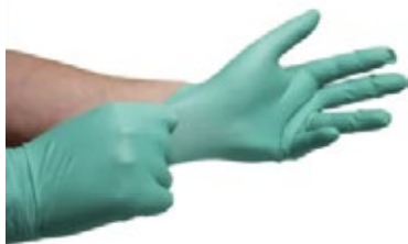
Luvas de Látex