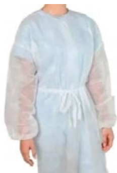
Capote Descartável Manga Longa