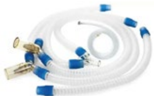
Circuitos para Oxigenoterapia