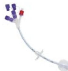
Sonda Gástrica (Sonda GTT)