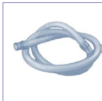
Traqueia PVC Cristal 2m X 1