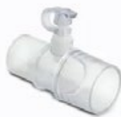
Conector de Oxigenoterapia