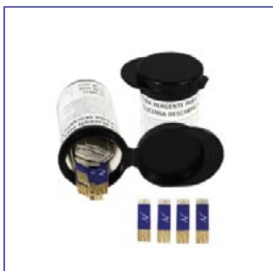
Tirante de Glicemia