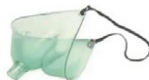
Máscaras de Hudson