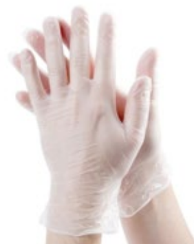
Luvas de Vinil