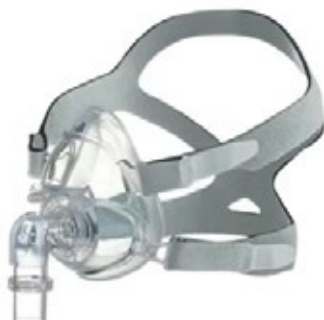
Máscaras CPAP e BiPAP