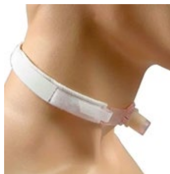
Fixador de Cânula de Traqueostomia