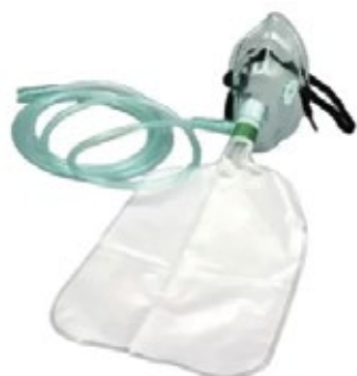
Máscaras para Oxigenoterapia