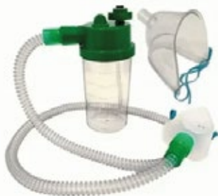
Kit Macronebulizador de Oxigênio Completo