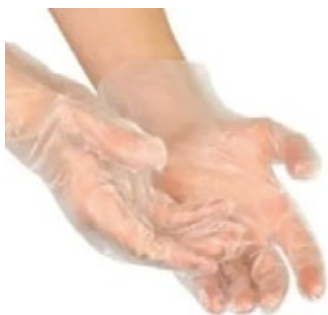
Luvas Plásticas Estéreis